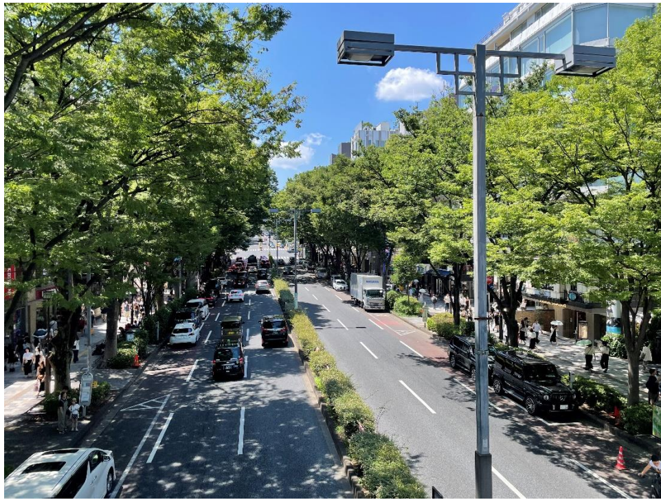
身近な植栽には、景観の向上や真夏に緑陰をもたらす効果もある(表参道のケヤキ街路樹)

ミツバ、キリシマ、クルメ、オオムラサキ、 ヒラド、ヤマ、ドウダン、サツキツツジ… 種類が多いなあ～(写真はヤマツツジ)