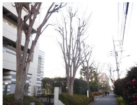
ケヤキ 基本剪定 作業後