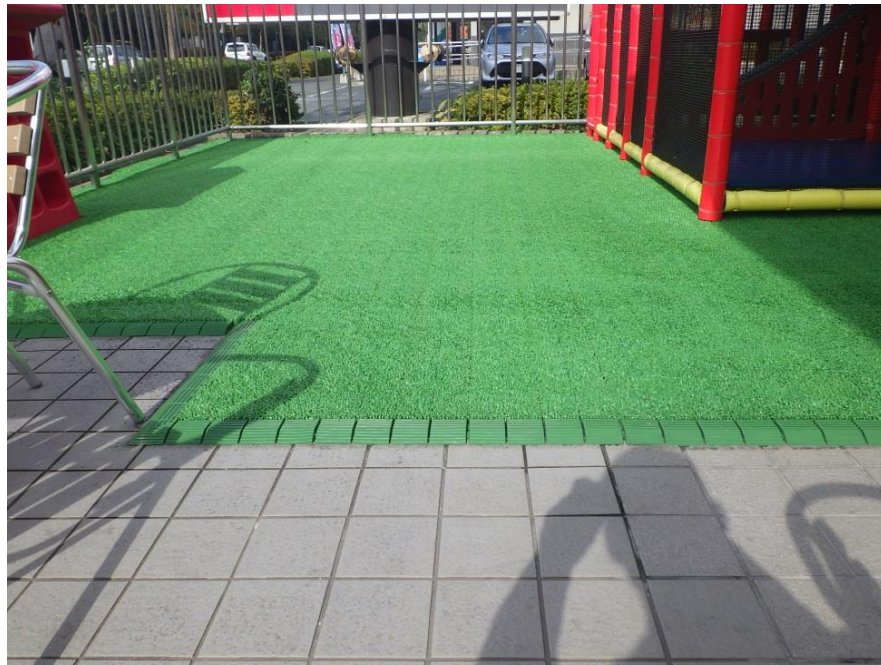
👉 遊戯スペースに敷設されたマットタイプの人工芝 容易に設置・取り外しができ、価格も手ごろなことからこのような遊戯スペースなどではよく使われています。

標高 1300m～2500m の高原地帯に自生し、日本では主にアッサムニオイザクラの名前で流通している。名の通り香りのある淡いピンク色の花が特徴で、濃いピンク色の園芸品種も存在する。