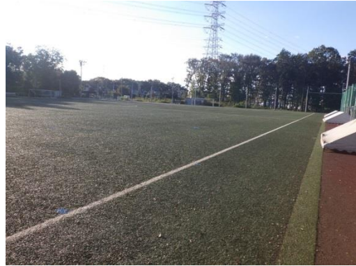
ロングパイル人工芝の競技場 フィールド縁の排水設備は色の異なる人工芝を設置することで容易に判別できるよう工夫がされている

また人工芝だけでなく、グラウンドの広さ、排水設備、防球対策など数々の厳しい要項をクリアした十文字学園女子大学サッカーグラウンドは、日本サッカー協会(JFA)のロングパイル人工芝公認ピッチとして、練習だけでなく地域レベルやユースクラスの公式戦でも使用が可能なハイクオリティなサッカーグラウンドとなっています。