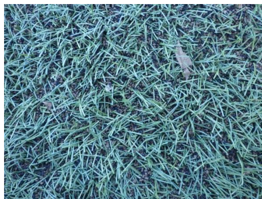
芝の中に見える黒い粒は充填材