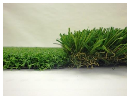
👉 左：カールタイプ人工芝(芝丈 13mm) 右：リアル人工芝(芝丈 35mm)