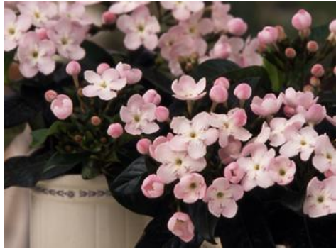
ルクリア(アッサムニオイザクラ)